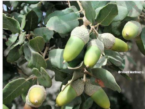
Foto de encina (Quercus ilex). Detalle del árbol, de las hojas y los frutos (bellota)